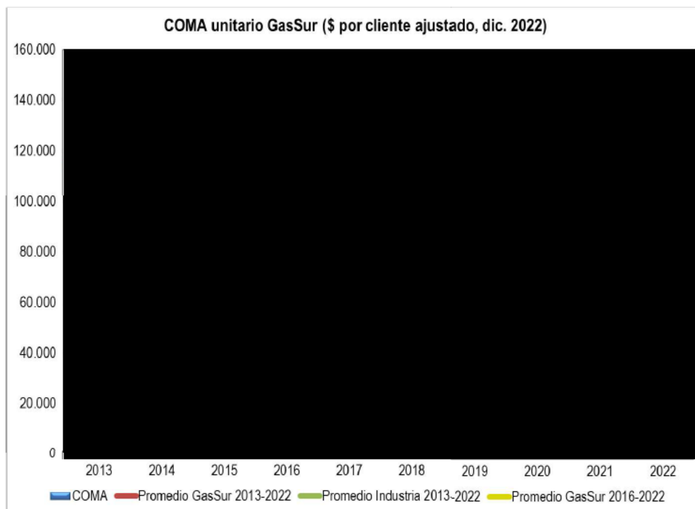
Gráfico I.3: COMA unitario – GasSur \alpha = 2,16\% ; \beta = 34,92\%