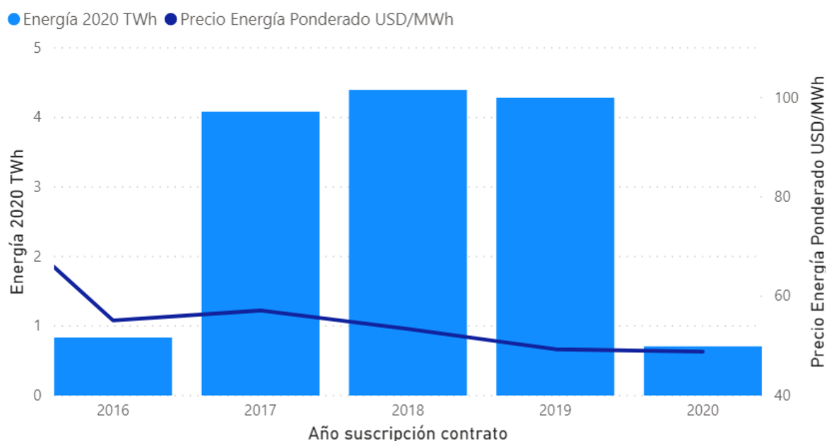
Figura 3.11.1: Energía comprometida por generadores y distribuidores en contratos con clientes libres ubicados en zonas de concesión de distribución