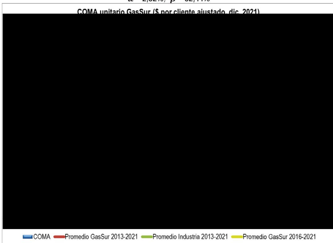
Gráfico I.3: COMA unitario – GasSur \alpha = 2,32\% ; \beta = 32,44\%

Con estos valores para los parámetros \alpha y \beta , el COMA unitario de GasSur para el año 2021 es un [REDACTED] al COMA unitario de GasSur para el año anterior. Asimismo, el COMA unitario de GasSur para el año 2021 es un [REDACTED] que el COMA unitario de la misma empresa para el periodo 2013-2021, y un [REDACTED] que el COMA unitario de GasSur para el período 2016-2021.