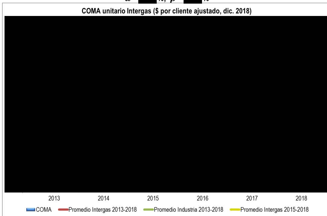
Gráfico I.1: COMA unitario – Intergas \alpha = \blacksquare\% ; \beta = \blacksquare\%

De los cálculos realizados se concluye que el COMA unitario de Intergas para el año 2018 es un \blacksquare\% menor que el COMA unitario de Intergas para el año 2017. Asimismo, el COMA unitario de Intergas para el año 2018 es un \blacksquare\% mayor al COMA unitario promedio de Intergas para el período 2013-2018 (calculado como el promedio aritmético), y un \blacksquare\% menor al COMA unitario promedio de Intergas para el período 2015-2018.