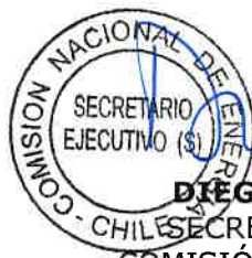
DIEGO PERALES ROEHRS SECRETARIO EJECUTIVO (S) COMISIÓN NACIONAL DE ENERGÍA