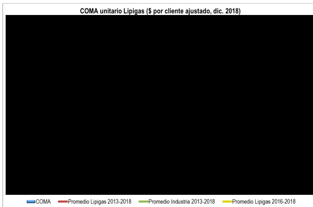
Gráfico I.1: COMA unitario – Lipigas \alpha = \blacksquare \beta = \blacksquare

De los cálculos realizados se concluye que el COMA unitario de Lipigas para el año 2018 es un \blacksquare al COMA unitario de Lipigas para el año 2017, y un \blacksquare que el COMA unitario de la misma empresa para el período 2016-2018 (calculado como el promedio aritmético). Asimismo, el COMA unitario de Lipigas para el año 2018 es un \blacksquare que el COMA unitario promedio de la industria para el período 2013-2018.