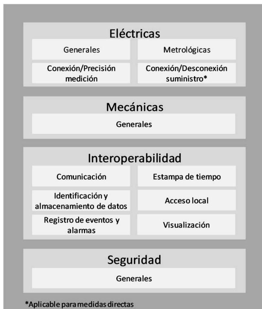
Figura 2: Categorías de exigencias para Unidades de Medida de los SMMC.

Las diferentes categorías de exigencias con las que deben cumplir las Unidades de Medida de los SMMC se detallan en la Figura 2.